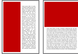
1/2 Seite 74 x 210 mm, 148 x 105 mm